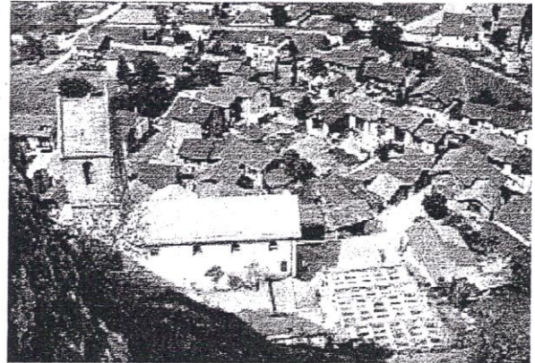
Blick auf die Burgschaft Niedergesteln von der "Feschti" aus

Von diesem Dorfgeist inspiriert, entschlossen wir uns, den Rundgang zu unterbrechen und im Restaurant Gestelnburg einzukehren. Der urchige Dialekt durchdringt die kleine Dorfbeiz. Ein paar Hausfrauen klopfen einen Jass; eine lebendige Stimmung erfasst das Wirtshaus und die Frauen übertreffen sich gegenseitig mit ihren Dorfgeschichten. Bei einem Bier hören wir amüsiert dem Geschehen zu. Die Serviertochter gibt uns bereitwillig Auskunft über die Neugestaltung des Dorfes.