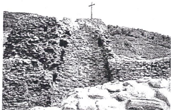
Die Mauerfragmente der Burgruine sind bis zu 7 Meter hoch

äusserst interessanten Einblick in das Innere des Feschtilochs.